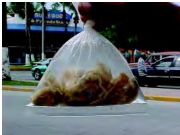
Figura 1 Venta de ostiones de dudosa procedencia en la vía pública.