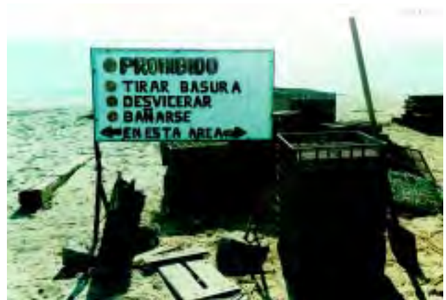
Figura 6 No se permitir/baCearse en/reas de cultivo, porque representa un peligro de contaminación biolSgica.

El primer paso para la disminución de riesgos en granjas ya establecidas, es la adopción de buenas prácticas de cultivo que establezcan las bases de higiene y sanidad necesarias para la producción de moluscos bivalvos, inocuos para el consumo humano (Figura 6). Al mismo tiempo es necesario un programa de capacitación para el personal de la granja, considerando los diferentes niveles de la estructura de la empresa, con el fin de que todos laboren bajo la misma política.