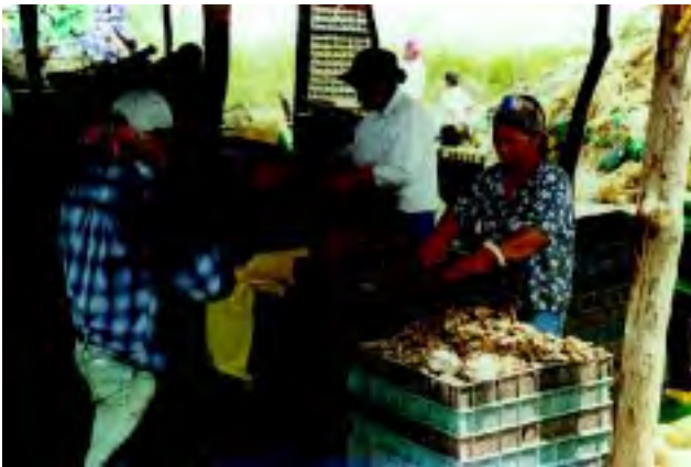
Figura 14 Considerar la higiene del personal, del equipo de recolección y de las instalaciones durante la cosecha.

■ El personal que participa en la cosecha, deberá cumplir con las observaciones de buenas prácticas de higiene descritas anteriormente. Se debe prohibir el uso de todo tipo de joyas, adornos, relojes, maquillaje, etc.; así como fumar, comer y escupir en las áreas de trabajo (Figura 14).