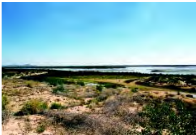
Figura 5 Las/reas a ser seleccionadas como sitios de cultivo deber/h estar alejados de asentamientos humanos, industrias, r TM osect.

■ Al momento de elegir el sitio, es importante considerar la posibilidad de tener un lugar de depuración con las debidas características como medida de mitigación en caso de una contaminación.