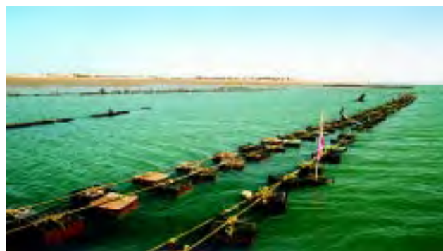
Figura 10 La autoridad dictaminará la localización de los puntos de muestreo para determinar la calidad del agua del área de cultivo.

a) «En áreas de cultivo donde existan fuentes de contaminación que tengan un impacto sobre la calidad del agua, se tomarán un mínimo de 30 muestras en cada punto de monitoreo en varias condiciones ambientales y será necesario clasificar cualquier área no clasificada anteriormente. Excepto para áreas de cultivo reconocidas como prohibidas».