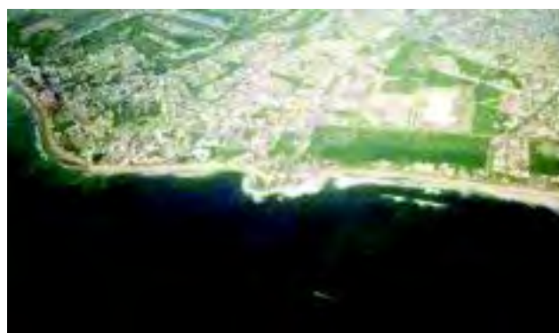
Figura 4 Presencia de marea roja en Mazatlán, Sin. (verano del 2000).

acumulados por los moluscos durante el proceso de filtración y provocar algún efecto nocivo al consumidor si los primeros no son sujetos a un proceso de depuración eficiente. Afortunadamente muchos de los plaguicidas con tiempos largos de residencia, han sido prohibidos por las autoridades y su uso ha disminuido considerablemente. Por otro lado, los metales pesados pueden ser acarreados por el agua de los ríos y entrar al primer eslabón de la cadena trófica (microalgas) para pasar posteriormente a los moluscos o bien ser absorbidos directamente de la columna de agua (Tabla 2).