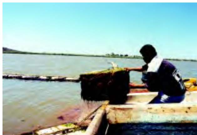
Figura 11 Traslado de moluscos a áreas de cultivo que cumplen con las especificaciones de buena calidad del agua.

Estas medidas se tomarán con base a la clasificación del sitio y por ende, del grado de contaminación y tipo de contaminante.