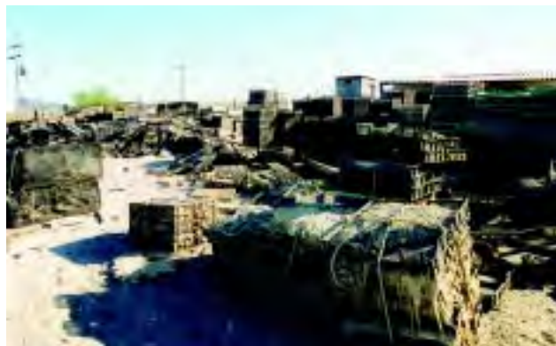
Figura 9 Es necesario contar con áreas delimitadas para desechos o material que no se utilice y alejadas del área de operaciones.

concentraciones adecuadas para evitar problemas sobre la inocuidad del producto. Si se requiere, se puede aplicar calor para destruir los microorganismos sobre la superficie.