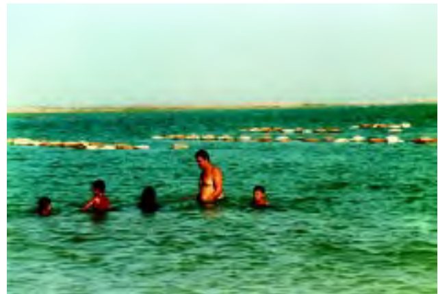
Figura 3 Las descargas de aguas negras de r TM os y/o el bañarse en áreas de cultivo son fuente de contaminación de bacterias entéricas.

La Tabla IV.1 y IV.3 (Anexo IV) resume información importante de algunos de los peligros mencionados.