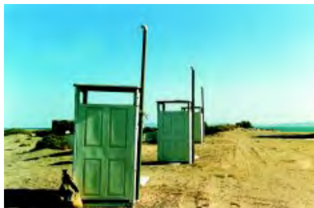
Figura 7 Las instalaciones deberán contar con letrinas para la higiene del personal y estas deberán estar alejadas de las áreas de cultivo y cosecha de los moluscos.

■ La granja debe contar con el equipo y materiales necesarios para la limpieza. Todo el equipo y utensilios en la granja deben mantenerse limpios y en caso necesario, también deben desinfectarse. Es importante que el equipo y material de limpieza que esté asignado a una sección específica de la granja, sea utilizado exclusivamente para esa área y no en otra, para prevenir la contaminación cruzada.