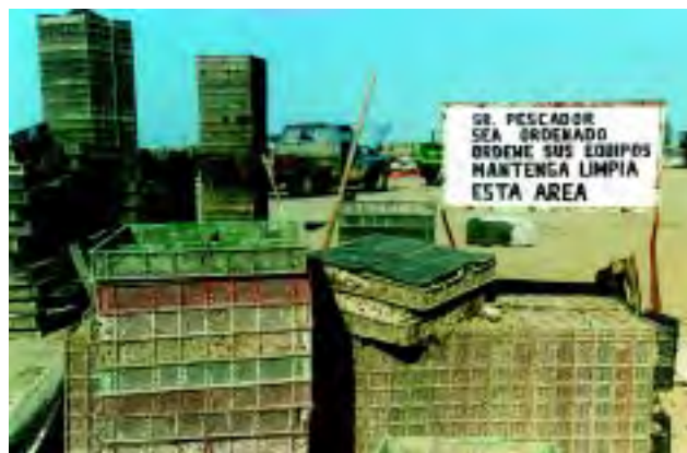
Figura 8 Mantener las instalaciones ordenadas e higiénicas, evita la presencia de plagas.

■ Si es necesario la aplicación de cualquier sustancia para el control o eliminación de plagas en cualquier parte del proceso, ésta debe realizarse por personal capacitado y cumplir con las especificaciones establecidas en el catálogo oficial de plaguicidas vigente del CICOPALFEST.