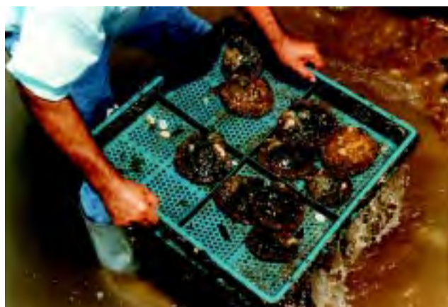
Figura 13 El equipo de captura y recolección debe ser adecuado para mantener la inocuidad de los moluscos.

Las áreas de cosecha y todo el equipo que se use debe ser lavado y descontaminado. Los materiales deben estar libre de corrosión, y no transmitir sustancias tóxicas (Figura 13).